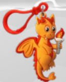
RECAUDA $5: Hearty